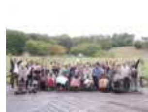
法人内日帰り旅行