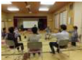
安井地区地域研修