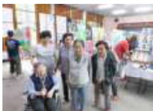
小中学校自由研究