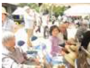
竹田小学校運動会