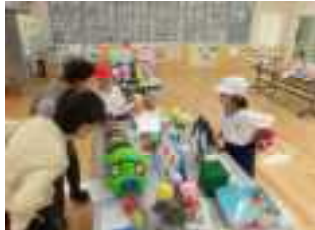
竹田小学校へ散歩