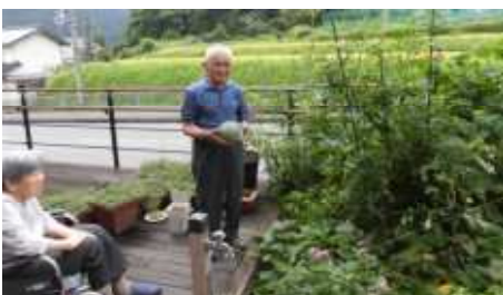
小玉スイカの収穫