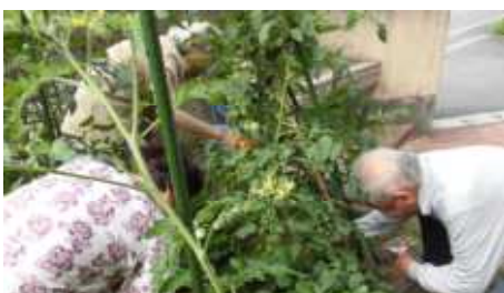
何種類ものトマトを収穫し 昼食にたくさんいただきました。