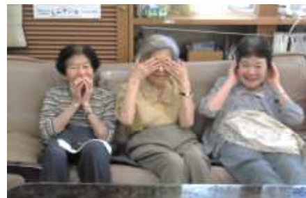
「見ざる聞かざる言わざる」