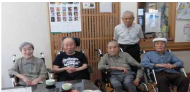
近所に住んでおられた方が面会に来られました。