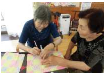
季節の手づくりうちわを作ります。