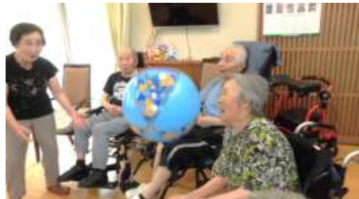
帰宅前のボール遊び