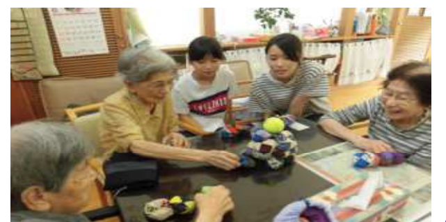
夏休みは高校生VRと職員の子供とひと時。