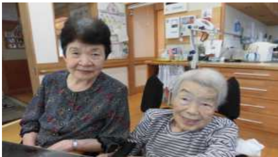
昔は一緒に働いてました。