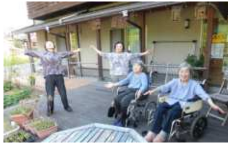
宿泊した朝、皆で外へ出て体操と深呼吸。