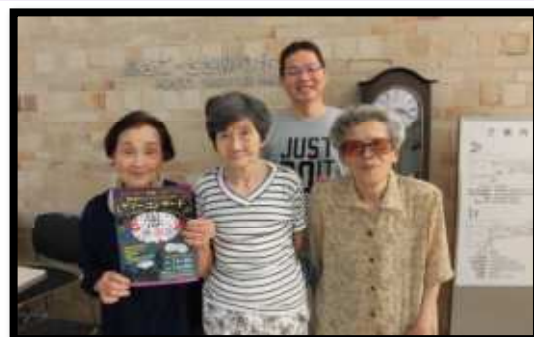
ウインドアンサンブルサマーコンサート