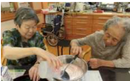
クッキングクラブ。混ぜて混ぜて。