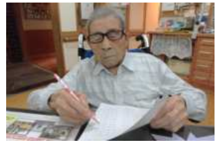
頭の体操で計算問題。