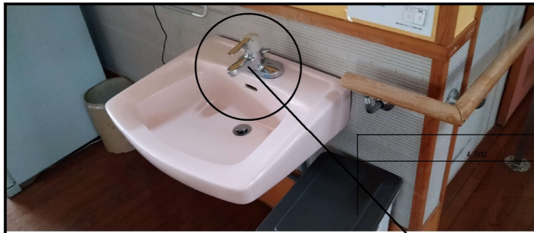
施工 第0-0026号内訳表参照